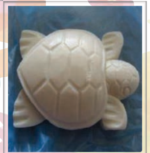
Talla de jabón