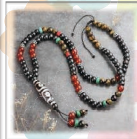
Fabricación de joyas

Estas clases ofrecerán una variedad de actividades creativas, tales como joyería, tallado de jabón, costura y